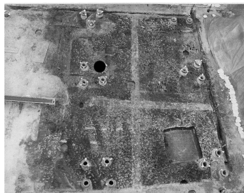
Figure1. The Onigahioya site (Mie University 2004)

鬼が塩屋遺跡(三重大学構内遺跡)は、三重県津市栗真町屋町に所在する。志登茂川河口部の砂堆部に位置しており、現在の標高は2m前後である(三重大学, 2004)。鬼が塩屋遺跡の発掘調査は、2003年に三重大学考古学研究室によって行われた。調査の結果、旧河道と推定される溝状の遺構が調査区南北にわたって検出された。遺物については、古墳時代前期の古式土師器を中心に、弥生土器・須恵器・製塩土器・山茶碗・土錐や土玉など、弥生時代から中世に至るまでの土器や土製品が確認されている。