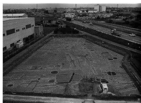
Figure2. The Ooke-oki site (Aichi Archaeological Center 1996)

大毛沖遺跡は、濃尾平野北東部の愛知県一宮市に所在し、標高9~10m前後の古代~中世を中心とした集落遺跡である(愛知県埋蔵文化財センター, 1996)。周辺の遺跡としては、すぐ北西に大毛池田遺跡が存在しており、同じく一宮市北部の木曾川町には北から北道手遺跡、田所遺跡、門間沼遺跡などの集落遺跡が多数存在している。大毛沖遺跡の発掘調査は、愛知県埋蔵文化財センターによって1993年度に行われた。発掘調査の結果、中世に属する区画溝を伴う居住、卒塔婆を含む廃棄土坑、さらに畝状遺構に伴う昆虫土坑が確認され、中世の集落像が明らかとなった。だがこの中世の居住域は、中世末期になると全く見られなくなる。かわってこの時期に、北西に隣接する大毛池田遺跡に居住域が展開することが確認されており、大毛池田遺跡に大毛沖遺跡にあったムラが移動したことが指摘されている(愛知県埋蔵文化財センター, 1996)。